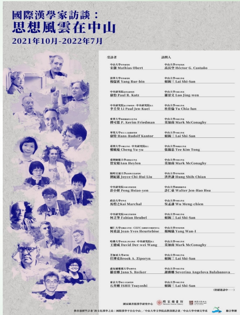
「國際漢學家訪談」總海報