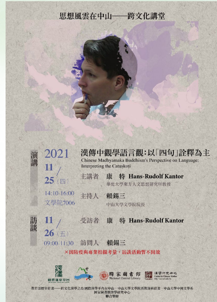
康特教授訪談及演講宣傳海報