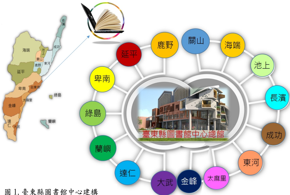
圖 1. 臺東縣圖書館中心建構

臺東充滿無限的可能，我們期許，臺東的每一個角落，將會是活力有勁最好的書香閱讀實驗室！