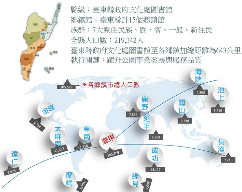
圖2. 臺東縣政府文化處圖書館中心總館與各鄉鎮分館的位置藍圖