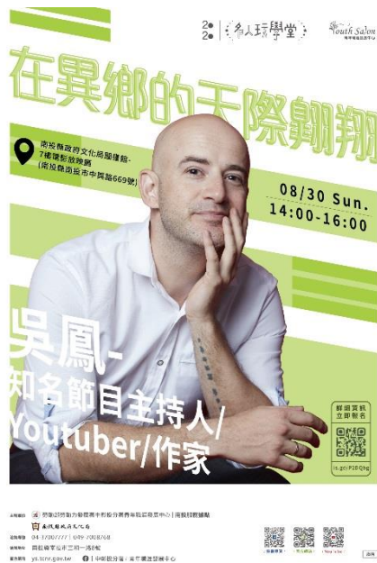
吳鳳名人講座(左)及「FUN 一夏」圖書館暑期歡樂季海報 (右) (圖 1)

文化局圖書館自 106 年度至 108 年度辦理多元閱讀推廣活動，皆盡力串連全縣 14 個公共圖書館家族力量，一同推廣閱讀。例如：「0-5 歲嬰幼兒閱讀起步走閱讀推廣」、「數位閱讀—電子書推廣活動」、「『FUN 一夏』—圖書館暑期歡樂季」、「樂齡閱讀活動」及跨界合作辦理名人講座，獲得民眾及青少年讀者極大迴響。