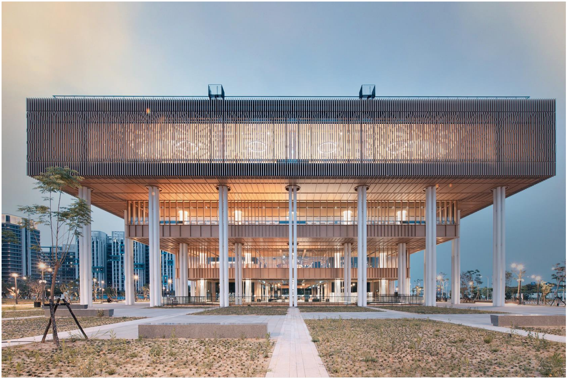
臺南市立圖書館 TAINAN PUBLIC LIBRARY