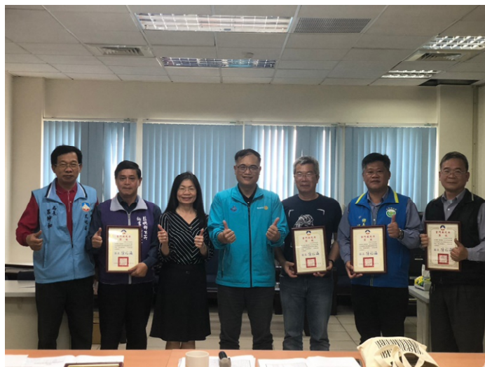
112 年金門縣公共圖書館發展委員會第 1 次會議

於 109 年 7 月 27 日確立金門縣公共圖書館發展委員會設置要點，並於 112 年 1 月 10 日修訂，邀請專任委員(國家圖書館館長、國立臺灣藝術大學圖書館館長、桃園市立圖書館館長、柯皓仁委員、邱子恆委員、洪玉貞委員)；各鄉鎮公所、教育處及文化局首長組成新一屆委員會，以及文化局圖書資訊科內人員共同參與，討論本縣公共圖書館發展之相關執行計畫、制度方針、組織體制等，以期能透過每場會報結果，作為未來本縣圖書館發展之指引方針。已於 112 年 3 月 22 日及 12 月 27 日由副縣長主持下召開 2 次會議。