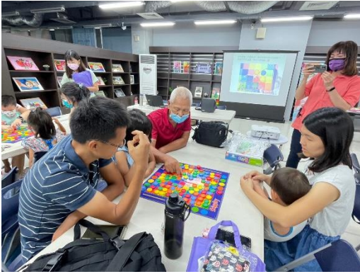
由育英醫專老人健康服務事業管理科師生指導親子桌遊