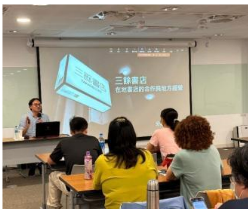
三餘書店店長分享在地書店的合作與地方經營，激發同仁更多的想像與可能。

邀請中華民國遊戲協會林君英創會理事長帶領同仁認識融合玩具、融合認證標章，及示範與體驗各種融合玩具。合計36名館員參與，課程滿意度為5分(滿分5分)。