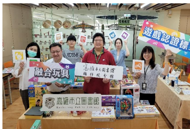
楠仔坑分館進行融合玩具示範認證