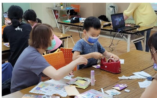
學員DIY製作南韓童玩「畫片」