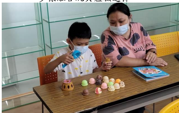
圖書館提供融合玩具創新服務 帶給使用者不一樣的共讀樂學經驗