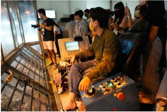
參訪「南區資源回收中心(焚化爐區)」

修理、衣物維修、海廢再生等，帶領高中職學生以全球視野，認識永續議題，並反思永續性如何於日常消費如何實踐，共計跨縣市吸引 31 位高中生參與。