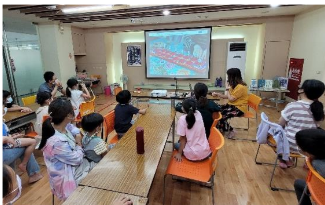
結合楠仔坑分館特色館藏「童玩」，介紹古老的童玩-播棋