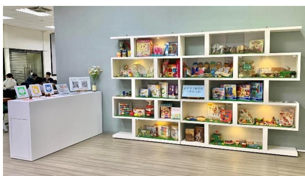
鳳山曹公分館融合玩具多寶格，提供讀者多樣融合玩具體驗選擇。

112 年延續 109 至 111 年度之融合玩具推廣量能，除既有之六大認證標章（視障、聽障、自閉症、多重障礙、銀髮、親子），亦切合各分館在地區位發展與館藏特色，新增第七項「多元文化」遊戲標章認證，合計購置 342 件融合玩具。在開放包容的友善共學精神之下，不僅讓民眾重溫兒時遊戲情懷，也讓參與者透過共融平權的學習機會，增進閱讀視野、培養文化自信心，使公共圖書館成為社區融合教育的最佳示範場域。