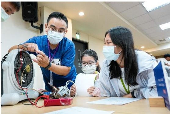
了解小家電維修咖啡館的實作