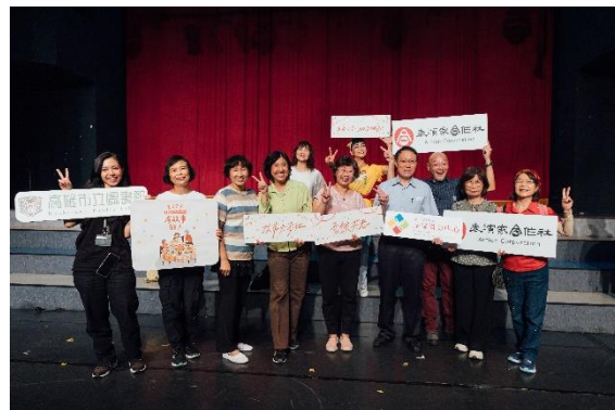
「有故事的人」豐富銀髮族的生活，帶 來不一樣的藝術文化體驗