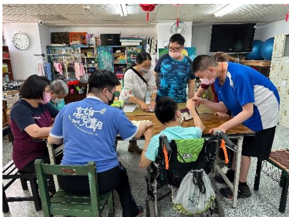
融合玩具推廣，前進腦性麻痺服務協會九如站，開啟更多障別的交流

與超過 90 個單位進行跨單位合作，如：社團法人高雄市腦性麻痺服務協會九如站、鳳山區兒童早期療育發展中心、臺灣玩具圖書館高雄玩具碼頭、楠梓親子館、高雄榮譽國民之家日照中心、世詠藥局-醫事 C 巷弄長照站、鳳山老人活動中心、淡江大學視障資源中心、社團法人台灣數位有聲書推展學會、分館鄰近小學等，將服務推得更廣、更深。