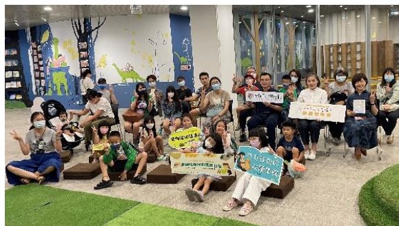
《一隻狗的遺囑》導讀，與民眾一起練習道愛、道謝及道別。