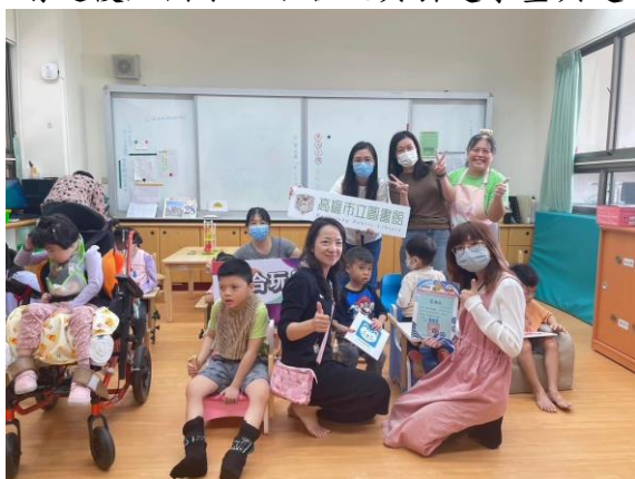
走進成功特殊教育學校，透過玩具打破障別隔閡，學員玩得超開心！