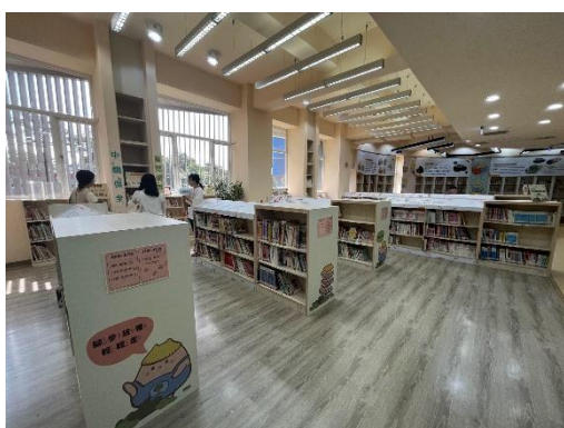
河堤分館建置繪本主題館

在總督導的帶領下，相互交流館舍營運經驗與營運增能的提點，實際進行館舍空間改造優化、閱讀推廣服務的辦理。並偕同研考單位訂定執行期程，定期召開分區輔導會議，檢視各階段輔導成效，適時滾動調整輔導內容，以構築分區大館帶領小館之效用。