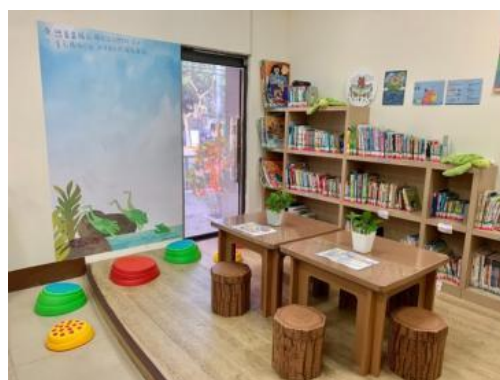
鳳山曹公分館嬰幼兒閱讀專區改造布置