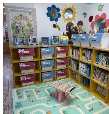
楠仔坑分館融合玩具專區