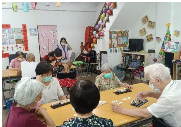
鼓山社區長照 C 據點阿公阿嬤以「拉密」展開機智對決