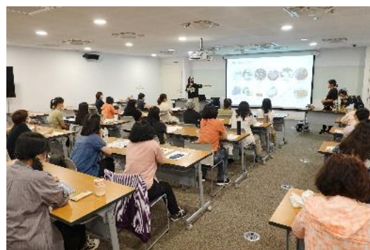
館員與志工學習帶領動物繪本說故事