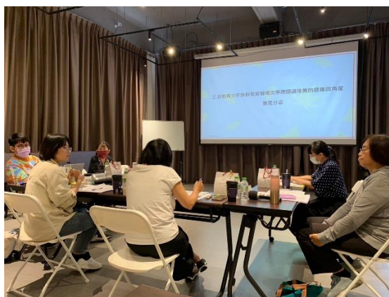
青少年文學選書會議，委員建議與經驗分享