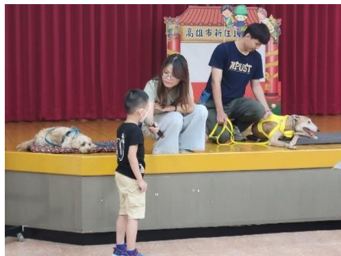
《閱讀犬出任務》屏科大工作犬訓練中心的閱讀犬團隊到高雄市新住民家庭中心服務新住民親子。