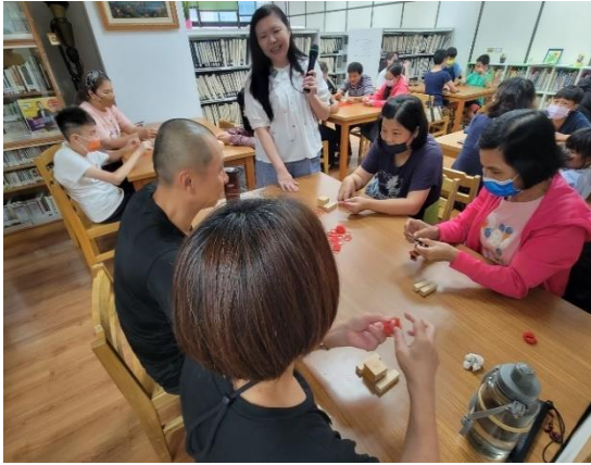
《High 玩桌遊趣》視障朋友體驗玩桌遊