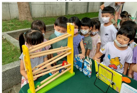
搭著行動書車至幼兒園，幼童體驗樂融融。