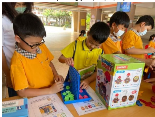
前進後庄國小，融合玩具引起學童興趣