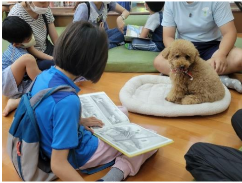
《琅琅故事屋》小朋友在狗狗的陪伴下閱讀繪本書