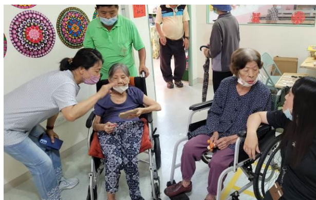
藉由閱讀推廣外展服務 將共融教育資源帶入社區