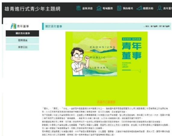
介紹本館相關青少年政策，利於青少年更了解圖書館、參與公共政策