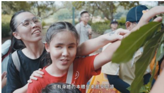
新興分館帶領視障者戶外走讀，透過五 體驗親近大自然