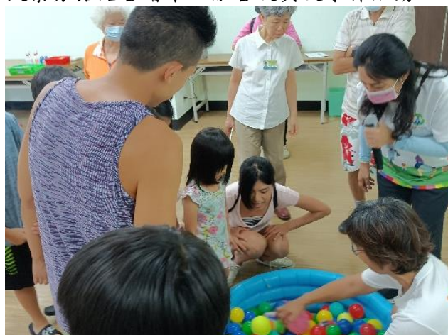
搭配繪本「彩色溫泉」，學員進行溫泉池尋寶