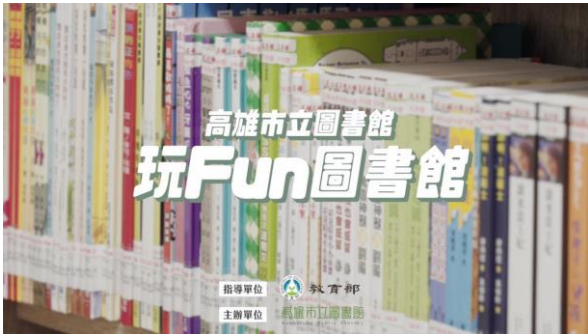
玩 Fun 圖書館-精選分館主題館影片集錦