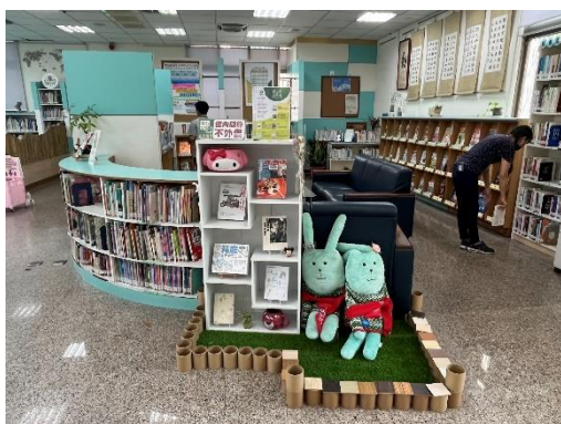
路竹分館進行期刊區改造