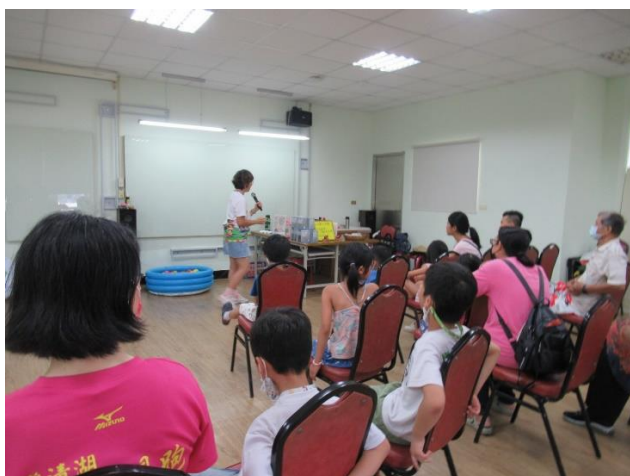
鼓山分館-演說繪本故事「彩色溫泉」