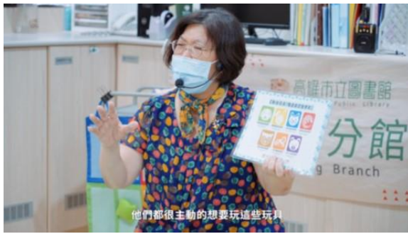
曹公分館經空間改造以後，提供適合樂 齡、身心障礙及親子互動更好的遊憩空 間