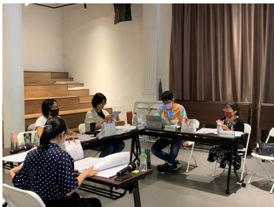
青少年文學選書會議，委員討論書單