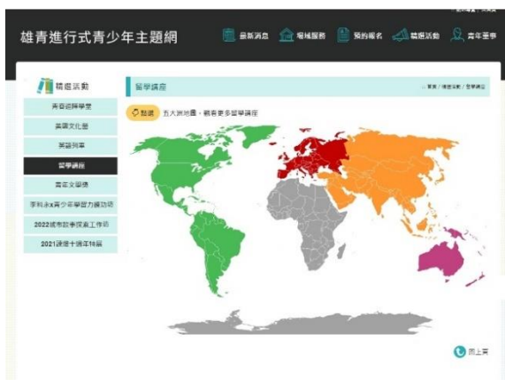
「精選活動」列出本館歷年辦理青少年活動