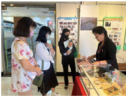
評鑑委員至林園分館聽取館舍導覽

為提升本館整體營運品質，除每年邀請圖書館界學者專家、圖書館實務工作者、媒體記者及社會賢達人士，擔任外聘評鑑委員之外，更配合內部管考機制，進一步核實前年度改善建議之執行成效。112 年度共 24 所分館參與評鑑、年度評分平均達 94 分，各分館的營運獲得委員們的一致肯定。