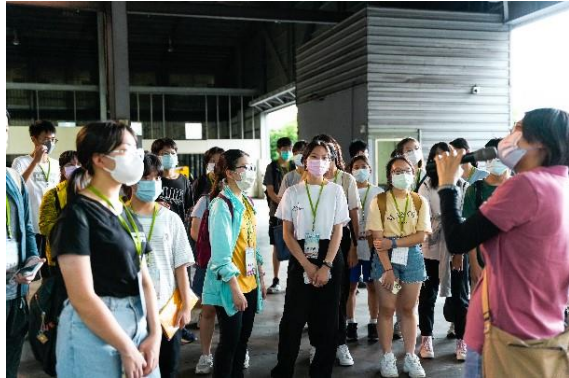
參訪「南區資源回收中心」