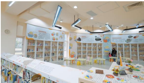
河堤分館結合國際繪本中心的資源，優化 兒童閱覽區