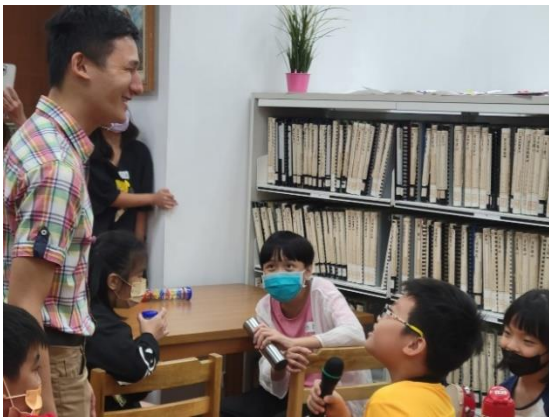
《耳朵帶我去探險，來個聲音輕旅行！》視障講師與孩童互動中