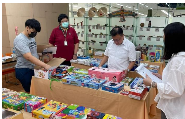
融合玩具認證現場，112 年新增取得第 7 種「多元文化遊戲認證標章」