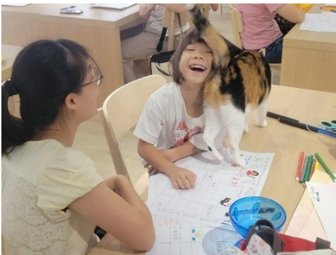
《認識貓咪的五感大調查》小朋友於活動現場開心與貓咪互動