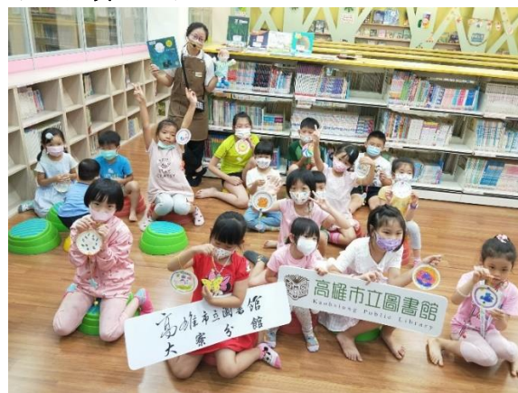
大寮分館結合繪本、融合玩具及手作活動