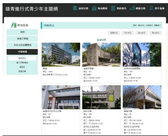
「場域服務」呈現全區 61 所圖書館資訊