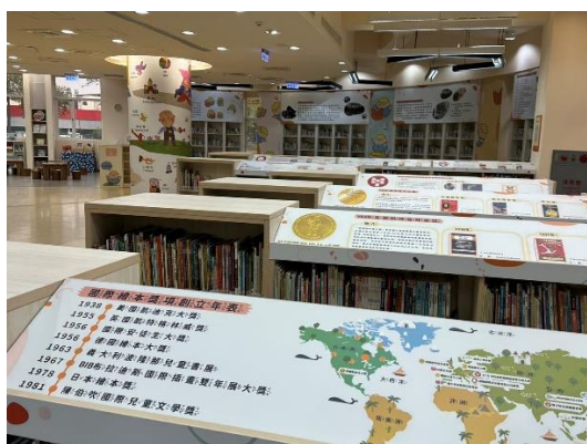
河堤分館介紹國內外知名繪本大獎，並辦理繪本推廣活動，提升繪本知識及增加廣度