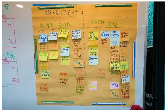
學員的心得回饋與分享