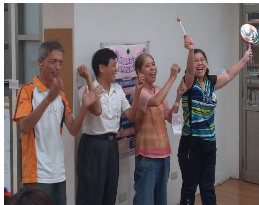
《敲敲音樂奇想繪》明盲朋友共同運用樂器表演