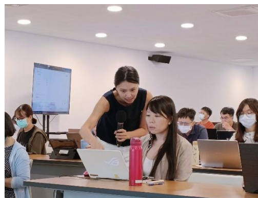
知名講師牧羊妮分享如何使用筆記軟體 Notion 管理日常及工作資訊。