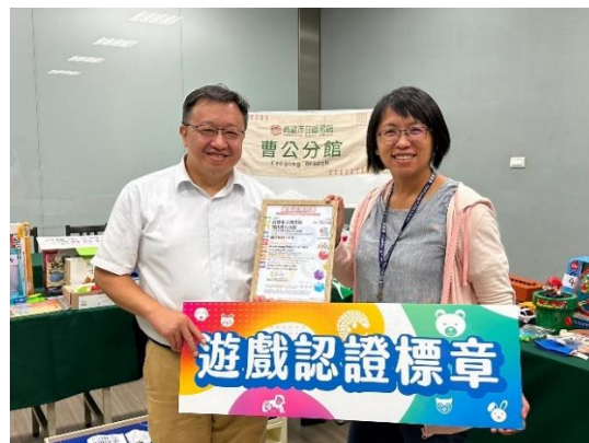
曹公分館進行融合玩具示範認證