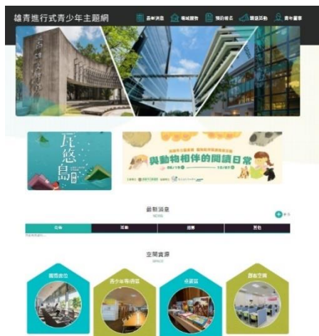
「首頁」以區塊、圖像式風格建置，方便青少年搜尋資訊

網站除整合符合青少年需求之閱讀資源之外，亦系統性串聯本館歷年辦理青少年閱讀推廣成果，讓使用者在搜尋上不費時、能快速獲得豐富資訊，以充分滿足青少年各項閱讀需求。