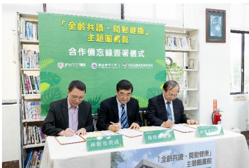
高醫大、育英醫專、高市圖簽署 MOU 備忘錄，滿足讀者身心健康保健需求