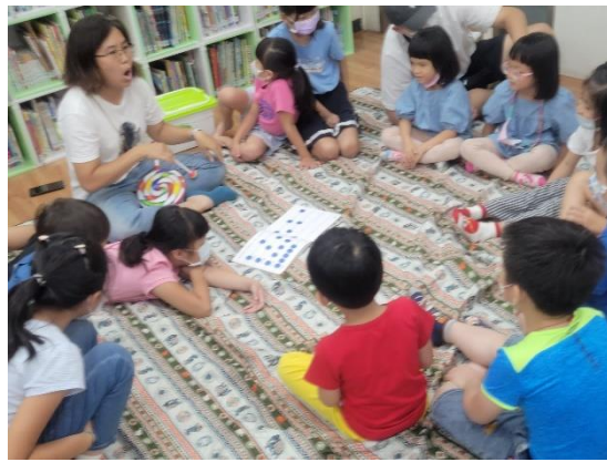
《Let's play together》老師運用繪本與明盲孩童玩聲音