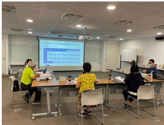
生態主題選書會議，委員討論書單