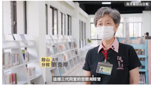
主任於影片中分享以三代同堂經營理念 打造玩具主題館