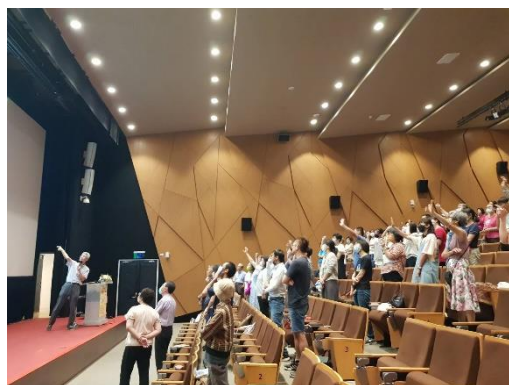
公廣集團董事長胡元輝邀請聽眾一同嘗試分辨 AI 生成圖片。