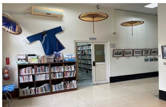
甲仙分館客家空間呈現在地主題特色