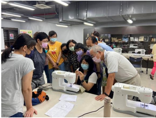
縫紉機課程工作坊，學員操作縫紉機 動手做專屬的飲料提袋