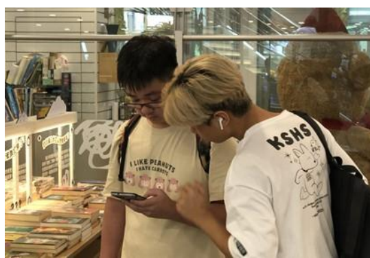
青少年在闖關遊戲過程中，認識自習以外的圖書館功能

「瓦悠島傳說」上線後吸引青少年、親子及學校機關團體入館體驗，累計超過 1,200 人次體驗，並邀請高雄市圖書教師分享如何透過遊戲結合圖書館利用教育，吸引近 90 名師長上線進行跨縣市交流。遊戲體驗意見調查，於「整體遊戲設計」、及「體驗後有助於瞭解高市圖總館館舍空間與服務的介紹」面向滿意度達 8 成，肯定因遊戲解謎歷程認識到過往未曾關注之圖書館功能。