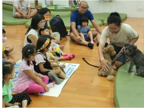
《琅琅故事屋》屏東科技大學工作犬訓練中心的閱讀犬團隊老師現場教導家長與小朋友與狗狗互動