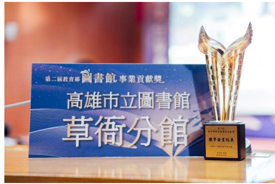
草衙分館 112 年榮獲「第二屆教育部圖書館事業貢獻獎-標竿圖書館獎」之殊榮