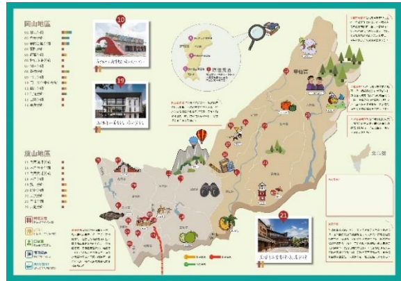
與正修科大電競系合作，製作「高市圖分館地圖集」(第2頁)。