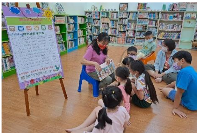
林園分館-遊戲前的繪本故事時光