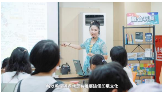
楠仔坑分館將融合玩具結合「民俗、童 玩」館藏特色，邀請新住民介紹當地童玩