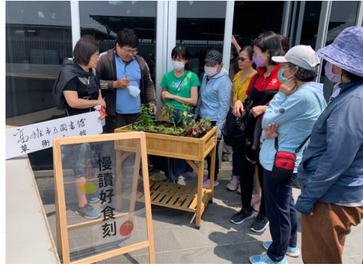
辦理「慢讀好食刻-在家種菜食農教育」課程