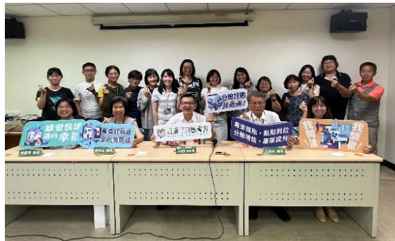
岡山區、旗山區綜合座談全員合影留念